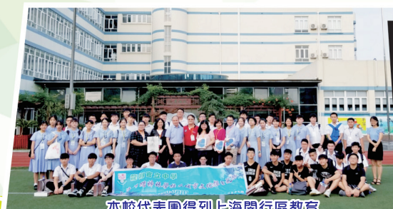
本校代表團得到上海閔行區教育學院附屬中學的師生熱情招待