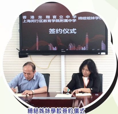
締結姊妹學校簽約儀式

在2018年6月2日，我們全體中三級同學從香港乘搭航班前往上海，抵達後率先乘車前往市區，考察浦東金融區，觀賞東方明珠塔及金茂大廈，遊覽有世界建築博覽群之稱的外灘，了解陸家嘴的發展及上海外灘的租界歷史，明白上海將浦東作為高度發展區的原因。