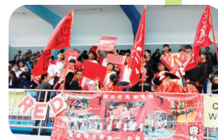
睿社勇奪啦啦隊全場總冠軍