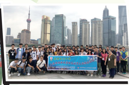
師生在上海外灘見證我國的高速發展