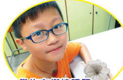
學生在銜接課程製作的別致作品