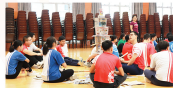
學生入營前的熱身活動已毫不簡單

為了幫助本校應屆香港中學文憑試的學生，盡早為升學及就業作好準備，升學及就業輔導組於2018年7月5日至6日，舉辦了兩日一夜的生涯規劃營，由班主任和本組老師透過活動協助同學釋除疑惑和擔憂，清晰與仔細地擬定升學及就業方向，讓學生更有信心面對出路。活動後學生對升學前景有更具體的認識，當中的反思環節更讓學生打開心扉，暢所欲言，師生間深入交流，學生的升學就業之路並不孤單。