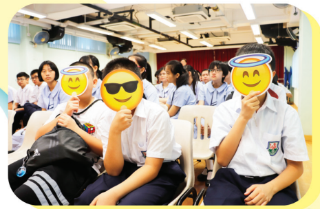
學生投入參與新生迎新日

凡此種種皆旨在讓新同學透過全方位的學習模式，享受多姿多采的校園生活，並建立對學校的歸屬感。