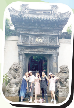
一群女生在豫園內留倩影