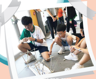
學生分組專注製作紙橋