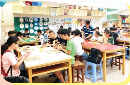
暑期中一銜接課程讓學生盡早融入校園生活