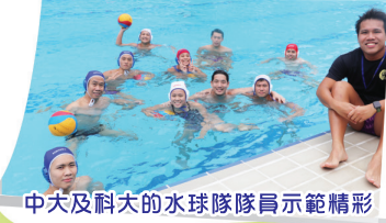
中大及科大水球隊隊員示範精彩