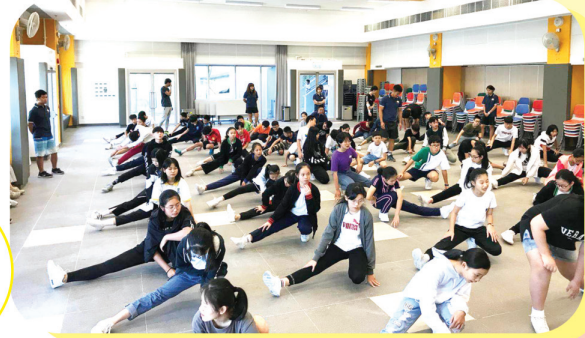
齊來熱身應付栽培營的艱苦挑戰