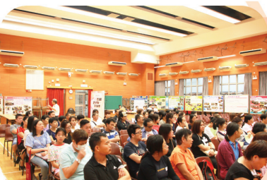
家長踴躍參與，關顧子女學習。

在9月1日舉辦的新生及家長迎新日，目的是為了使學生及家長對龍翔官立中學有更深認識，培養良好的家校合作關係。活動當日安排了講座環節，為各位新生家長介紹本校的辦學特色、學習支援、教學設施等，還有步操樂團和英語歌曲合唱表演，及特別為各級新生舉辦的遊戲活動，藉此機會為新同學在新學年開始前打打氣，迎接豐盛的校園生活。整個活動得到家長及學生的支持，在一片歡樂聲中圓滿結束。