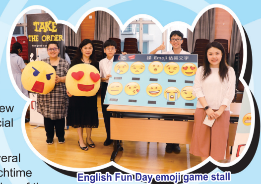
English Fun Day emoji game stall

Also, during the welcome week, we had the English Fun Day. All the students came to the hall throughout the day to participate in various exciting and educational English games and activities. The English Ping Pong was especially popular, with students having to say special English words every time they hit the ball.