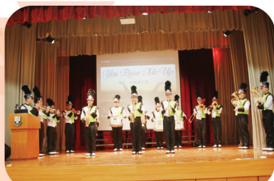
步操樂團演奏出色為活動生輝