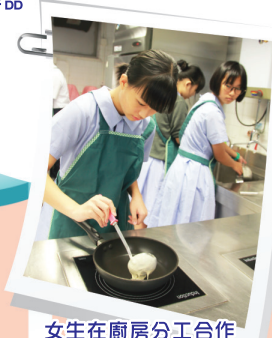
女生在廚房分工合作