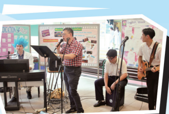
English Lunchtime Concert